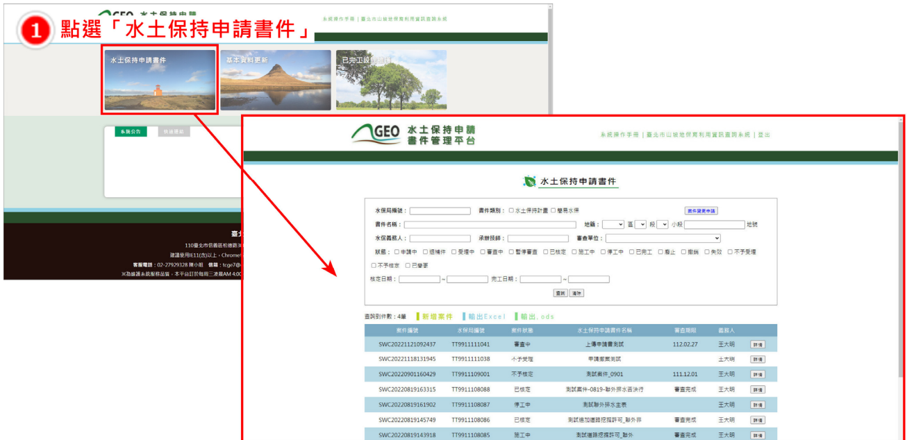
圖 7：義務人水土保持計畫案件列表畫面截圖

可於登入系統後，於主選單頁面點選「水土保持申請書件」，進入案件列表後，點選欲瀏覽資訊之水土保持計畫案件即可。