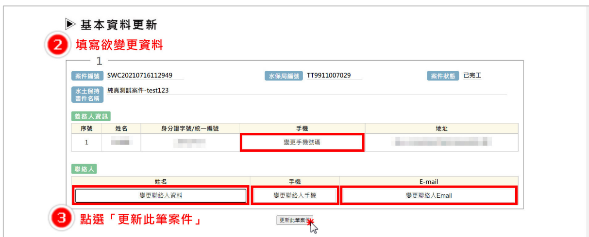
圖 5：填寫變更資料後點選「更新此筆資料」

若義務人需針對特定案件進行基本資料更新時，可於紅框圈選之資料欄位更新資料後，點選「更新此筆案件」，系統即會自動更新列表中該案件之義務人資訊。若該筆案件為多位義務人，登入者 僅能編輯自己及聯絡人之基本資料 ，無法編輯其他義務人之資料。